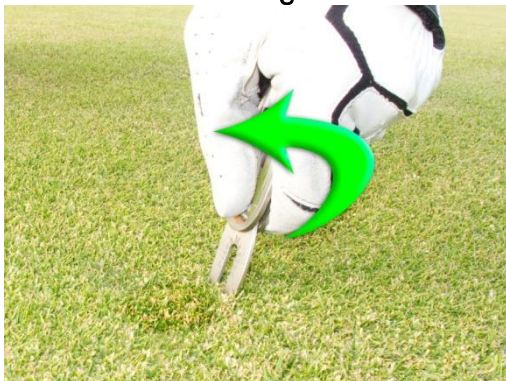
Das Loch zusammen drücken